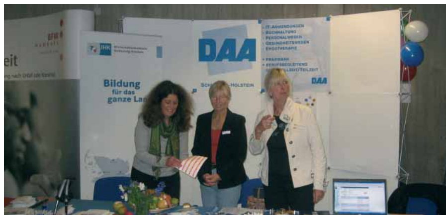
Bildung für das ganze Land" – so lautete das Motto der Schleswig-Holsteiner Aktivitäten zum Zweiten Deutschen Weiterbildungstag.

Für nicht ausdrücklich schriftlich angeforderte Texte, Fotos oder Grafiken übernimmt die DAA-Stiftung keine Haftung. Die DAA-Stiftung behält sich Kürzungen der eingereichten Texte vor. Ein Recht auf Abdruck besteht nicht.