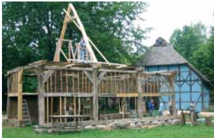
Die Scheune aus dem Jahr 1573 wird im Rahmen einer Qualifizierungsmaßnahme der DAA GmbH, Kundencenter Uelzen, von arbeitslosen Handwerkern aufgebaut.

Im Museumsdorf in Hösseringen hat eines der ältesten Nebengebäude Niedersachsens ein neues Zuhause gefunden. Die Scheune aus dem Jahr 1573 stand bis 1984 noch in Altenebstorf und wird nun eine weitere Sehenswürdigkeit des Freilichtmuseums der Lüneburger Heide. Möglich wurde dies unter anderem durch eine Qualifizierungsmaßnahme für arbeitslose Bauhandwerker.