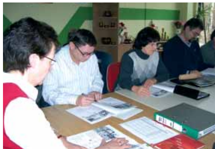
Teilnehmer des Projektes „Jahresringe“ im Aus- u. Weiterbildungszentrum Köthen bei einer Veranstaltung über „Einstellungstests und Stressbewältigung“.

besonders in dieser Altersgruppe sehr viel Wert gelegt auf Prävention, Fitness und gesunde Ernährung. Dazu laden wir Vertreter der Krankenkassen zu Themen wie Stressbewältigung, Gehirnjogging und Fitness für Körper und Seele ein. Unternehmer der Region berichten über die Anforderungen ihres Unternehmens an den Bewerber, geben Tipps zu Bewerbung und Verhalten in Vorstellungsgesprächen und bieten nicht zuletzt oftmals auch eigene freie Arbeitsstellen an.