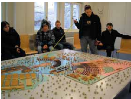
Die Gruppe am Lagermodell in der Jugendbegegnungsstätte der KZ-Gedenkstätte Buchenwald.