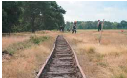
Teilnehmer des Projekts SpurWechsel legen eine stillgelegte Moorbahnstrecke frei und bereiten die Anlage für touristische Zwecke auf.

RuN und SpurWechsel wurden nach der obligatorischen Erprobungsphase wegen unerwarteter positiver Integrationserfolge (45%) in den 1. Arbeitsmarkt und stabiler Verbleibsquoten (Maßnahmeabbrüche weniger als 20%) verlängert. Und die „weichen Faktoren“: Unübersehbare Stabilisierungswirkungen der Maßnahme auf teilweise schwerstvermittelbare Teilnehmende und rundum positive Rückmeldungen aus