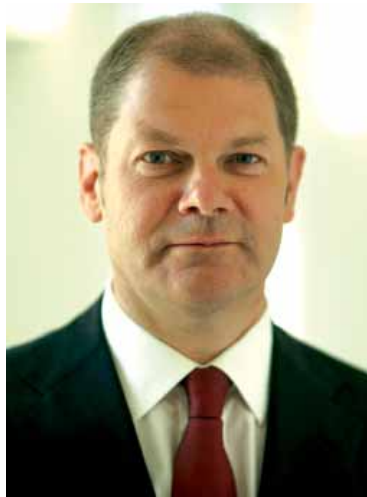
Olaf Scholz Bundesminister für Arbeit und Soziales

ganz wesentlicher Schritt gegen wettbewerbsschädlichen Dumpingwettbewerb getan. Dies ist bereits deutlich geworden, denn in den neuen Ausschreibungen der Bundesagentur für Arbeit wird auf das Arbeitnehmer-Entsendegesetz (AEntG) Bezug genommen. Es wird dort den Bietern empfohlen zu berücksichtigen, dass der tariflich festgelegte Mindestlohn gelten wird. Ein großes Ziel ist damit in greifbare Nähe gerückt: ein Ende des ruinösen Wettbewerbs, der auf dem Rücken der Beschäftigten in der Weiterbildung ausgetragen wurde. Zu danken ist allen, die mit langem Atem, mit hohem Engagement und Durchsetzungsvermögen die Änderung des Entsendegesetzes durchgesetzt haben, insbesondere Bundesminister Olaf Scholz, der uns auch noch für ein kurzes Interview zur Verfügung stand.