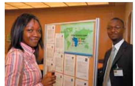
Impressionen von der Personalbörse International – die 80 Bewerber/-innen kamen aus 28 Nationen

wurden personenseitig durch (angehende) Absolventen und Absolventinnen aus den Hochschulen Ostwestfalens aufgewertet. Mehr als 40 Unternehmen nutzten die Gelegenheit zu Kennenlern- und Bewerbungsgesprächen mit den über 160 Bewerber/-innen. Annähernd 20 Arbeitsverträge konnten rund um die Börsen geschlossen werden.