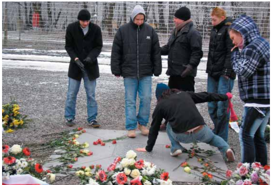
Unser Bild zeigt eine Gedenktafel, die um an das Leben zu erinnern, ganzjährig auf Körpertemperatur erwärmt wird.

Zum anderen wurden verstärkt die Lebensbedingungen im Lager thematisiert. Wie lief ein Tag im Leben der Häftlinge ab, wie viele