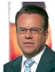
Frank-Jürgen Weise, Chef der BA seit 2004, soll im nächsten Jahr 2 Milliarden Euro im Etat sparen.

losen zugute kommt, zurückgefahren wird. Dabei ist gerade bei den Langzeitarbeitslosen festzustellen, dass diese nur marginal von der positiven Wirtschaftslage und dem Fachkräftemangel profitieren. Hier wird es durch die Mittelkürzungen zu einer Verfestigung der Arbeitslosigkeit kommen, der man mit langfristigen Qualifizierungsmaßnahmen begegnen müsste. Doch dafür fehlen jetzt die Mittel!