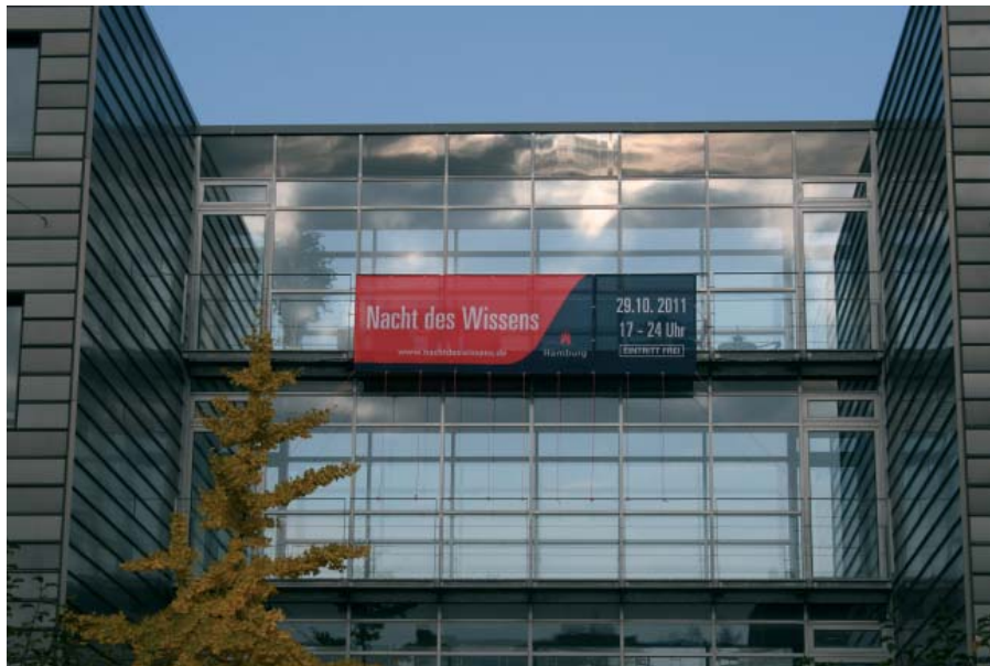
Das Banner der „Nacht des Wissens“ am Gebäude der HFH in Hamburg

Ende Oktober fand in Hamburg die 4. Nacht des Wissens statt, an der rund 45 Hochschulen, wissenschaftliche Institute und Einrichtungen teilgenommen haben. Die Hamburger Fern-Hochschule war in diesem Jahr erstmalig mit dabei.