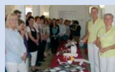
DAA Hannover: Projekt Futura