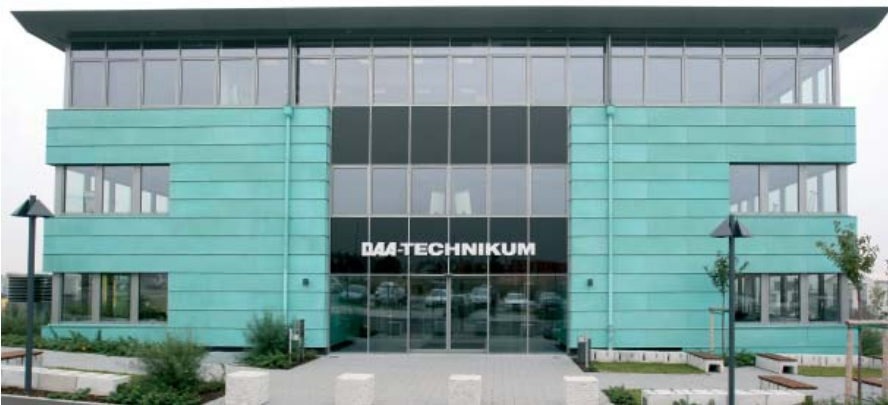
Das neue Gebäude verfügt mit seinen ca. 6.500 qm über modern ausgestattete Seminarräume, PC-Einzelarbeitsplätze und Labore.

errichten, für alle Beteiligten sicherlich nicht einfach war. Doch sie ergab sich einfach für das DAA-Technikum aus der Notwendigkeit heraus, dem neuen pädagogischen Konzept für die berufsbegleitenden Technikerlehrgänge Rechnung zu tragen. Dieses Konzept zielt darauf ab, die berufliche Handlungskompetenz der angehenden Techniker und Technikerinnen im Ganzen zu erweitern. Diesem Anspruch konnte das alte Gebäude in der Berner Straße nicht mehr im vollen Umfang gerecht werden, sodass der jetzige Neubau unumgänglich wurde.