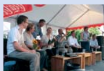
Fünf Jahre DAA Berlin-Neukölln: Chancen für Bildung und Arbeit