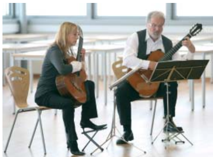
Für die musikalische Gestaltung der Einweihungsfeier sorgte das Gitarrenduo Heinel.

Diese Methode verbindet das Lernen in der Gemeinschaft mit dem Selbststudium zu Hause. Das Besondere an der Dualmethode ist, dass sie die besonderen Bedingungen berufstätiger Arbeitnehmer berücksichtigt und somit ein flexibles und individuelles Lernen ermöglicht. Die Methode steht auf zwei wichtigen Eckpfeilern: Zum einen auf dem selbsterklärenden und ausgereiften Studienmaterial, zum anderen auf dem bereits erwähnten pädagogischen Konzept.