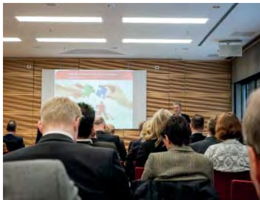
Das Bildungsträgertreffen war gut besucht. Etwa 80 Fachleute informierten sich über mögliche Änderungen und Neuerungen.

sollen mit diesen Teilqualifikationen dann Externenprüfungen und die Anerkennung entsprechender formaler Abschlüsse befördert werden, damit die Chancen auf Vermittlung steigen.